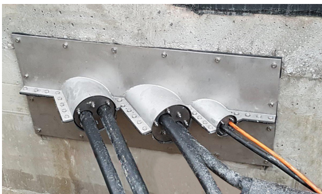
Solución: Dimensionamiento de una brida con saledizo con diseño seccionado, con diferentes salidas de los casquillos de los tubos en función del ángulo de salida de los cables. Imagen: Entrada de cables en el canal de medios