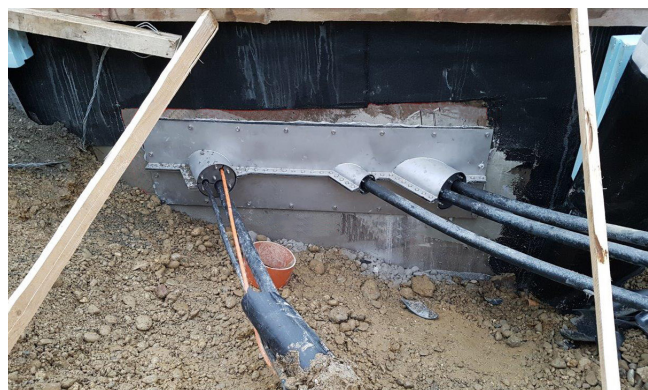
Imagen: Salida de cables del canal de medios