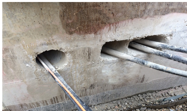
Particularidad: Los cables entran y salen del canal de medios con diferentes ángulos. La longitud de los cables no se puede modificar. Imagen: Salida de cables del canal de medios