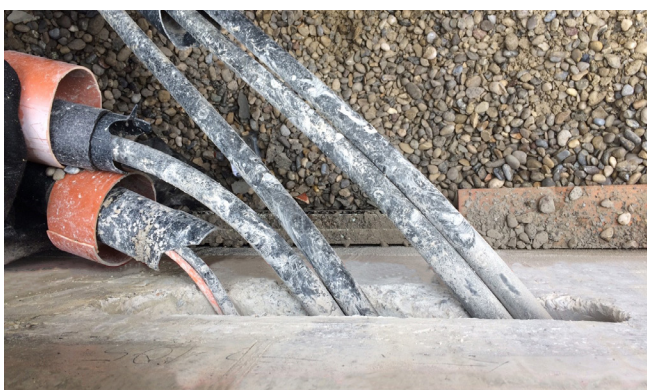
Vista detallada: Entrada de cables en el canal de medios