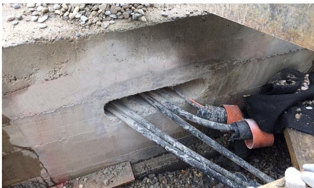
Los conductos de suministro principales existentes no se pudieron reubicar por la creación de un canal de medios accesible. Durante la construcción, se liberó un receso alrededor de los cables. Imagen: Entrada de cables en el canal de medios