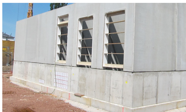
A pince helyszíni betonozása után felépítették az üzemi épület előregyártott betonfalak formájában.