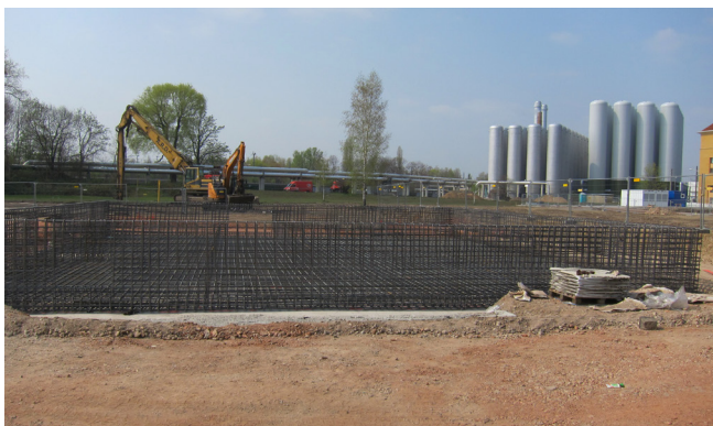
Az üzemi épületet több szakaszban betonozták.