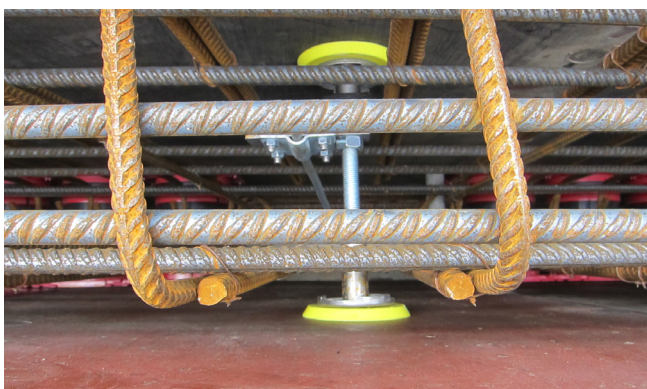
A kábelátvezetések mellett földelési átvezetések is megvalósultak, csatlakoztatási lehetőséggel a vasvázhoz.