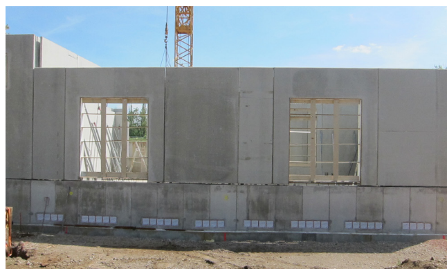
A különböző bevezetési helyzeteket a HSI150 különböző méretű kötegváltozataival kiviteleztek.