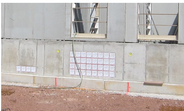
A köteges elrendezésű HSI150 az optimális megoldás a kábelbevezetésre. Ezáltal nagy elhelyezési sűrűség valósítható meg minimális helyszükséglettel.