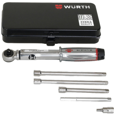
Werkzeugset für HSI150 DG/HRK SSG