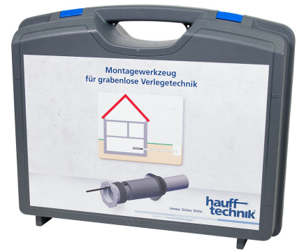
Montagekoffer MIS NoDig