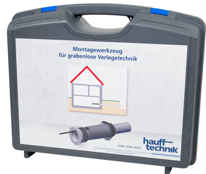
Montagekoffer MIS NoDig