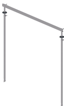
Dispositivo de ajuste