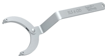
Llave de gancho articulada