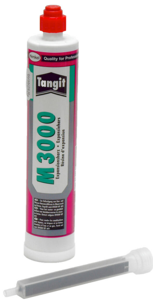
Resina bicomponente M3000