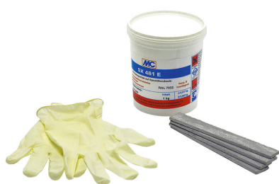
kit de montaje