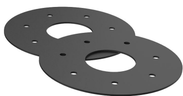
Incrustaciones de goma