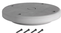
Placa de soporte ETGAR