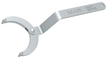
Llave de gancho articulada