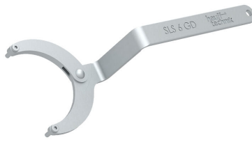
Clé universelle à ergots