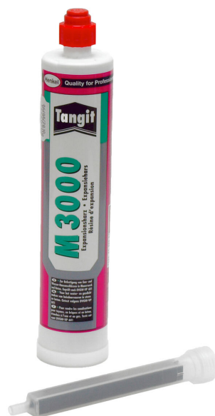
Résine bicomposant M3000