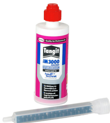
Résine bicomposant iM3000