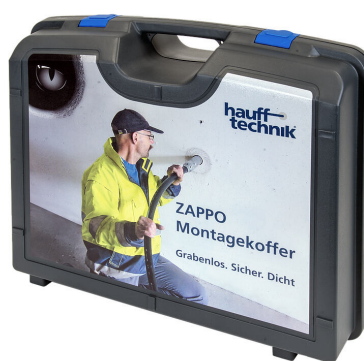
Coffret d'installation ZAPPO