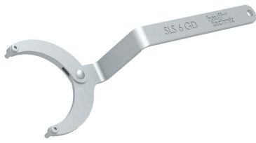
Clé universelle à ergots