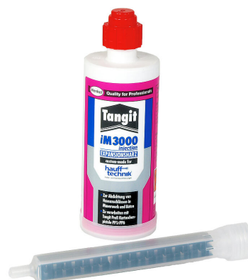
Résine bicomposant iM3000