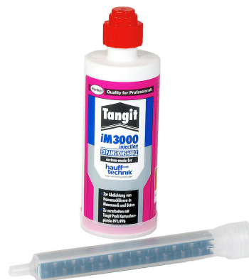
Résine bicomposant iM3000