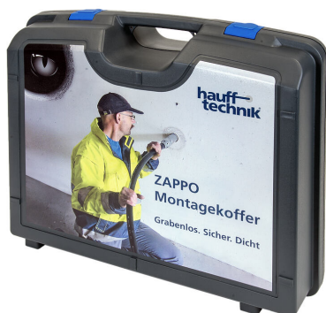
Coffret d'installation ZAPPO