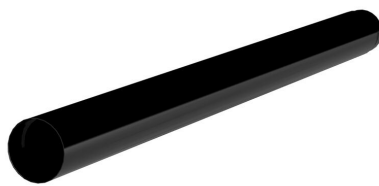
Tuyau de creusement ZAPPO