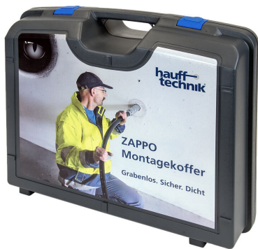
Coffret d'installation ZAPPO