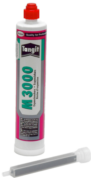
Résine bicomposant M3000