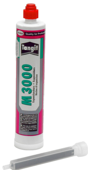
Résine bicomposant M3000