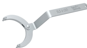
Zglobni ključ za matice s dvije rupe