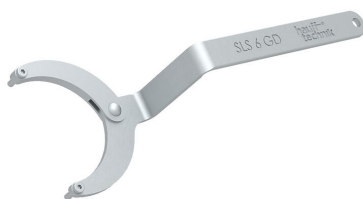
Zglobni ključ za matice s dvije rupe