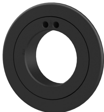
Rozeta za završetak zida