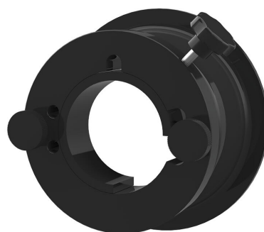
Naprava za brzo pritezanje MIS