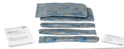
Slika može odstupati od odabranog proizvoda

Plinotijesna i vodotijesna protupožarna barijera u skladu s razredom protupožarne zaštite S90 prema normi DIN 4102-9 za ugradnju u krunske provrte odnosno plastične proturne cijevi za zidove. Brtvljenje se vrši pomoću prstenaste brtve HRD. Barijera je dopuštena za sve vrste kabela u otvorima zidova do \varnothing 300 mm.