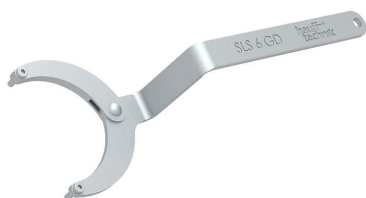
Zglobni ključ za matice s dvije rupe