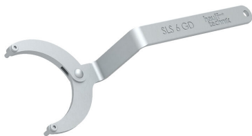
Zglobni ključ za matice s dvije rupe