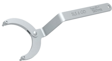
Zglobni ključ za matice s dvije rupe