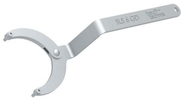
Zglobni ključ za matice s dvije rupe