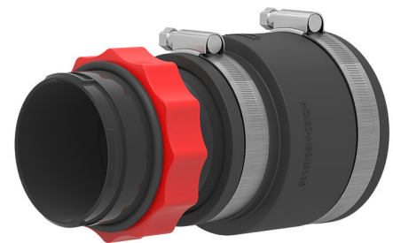
Slika može odstupati od odabranog proizvoda

Za priključivanje spiralnog crijeva Hateflex 14090 na zidnu uvodnicu ili aluminijsku prirubnicu HSI90.