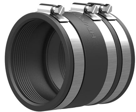
Slika može odstupati od odabranog proizvoda

Manžeta za montažu vodovodnog voda na kraju spiralnog crijeva Hateflex 14110. U spoju s izmjenjivim umetkom WE 125-z/d vod se može brtviti gumenom pritisnom tehnologijom.