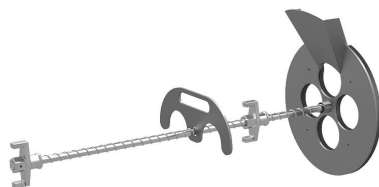
Uređaj za punjenje