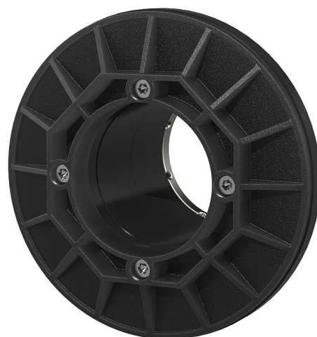
Slika može odstupati od odabranog proizvoda

Gumena tlačna brtva s prekrivajućom prirubnicom za povezivanje postojećih brtvi u zgradama s podrumom. Zbog širine brtvljenja od 80 mm prikladna je za brtvljenje u krunskim provrtima dvostrukih zidova/dijafragmi. Modul 6.2 zabrtvljuje betonsku oplatu dvostrukog zida i beton izliven na licu mjesta. Tako se sprječava da voda čija se razina podiže u području između dvostrukog zida i betona izlivenog na licu mjesta dospije u krunski provrt.