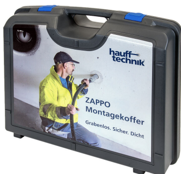
Kutija za montažu ZAPPO