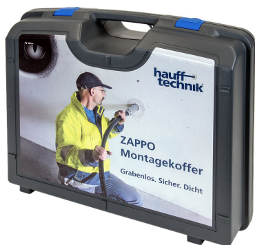
Kutija za montažu ZAPPO