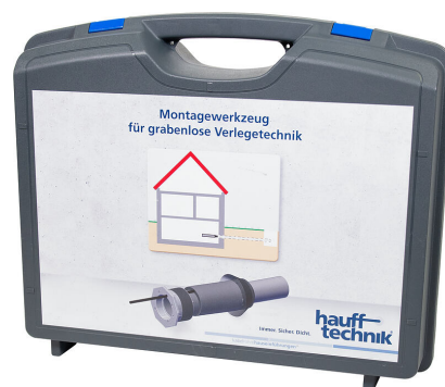
Kutija za montažu MIS NoDig