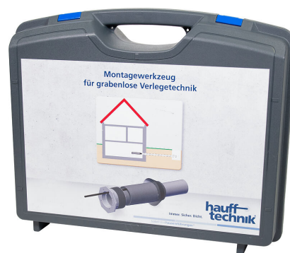
Kutija za montažu MIS NoDig