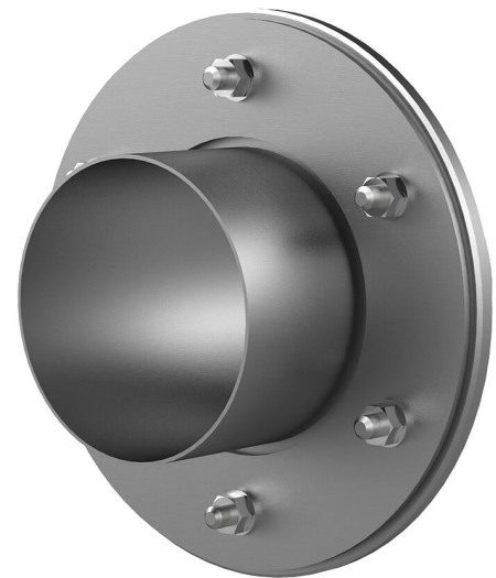
Slika može odstupati od odabranog proizvoda

Za zataplavanje putem proturane cijevi, krunskog provrta ili proboja.