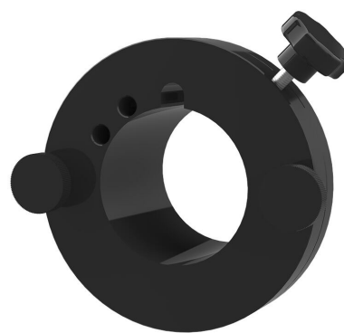
Naprava za brzo pritezanje