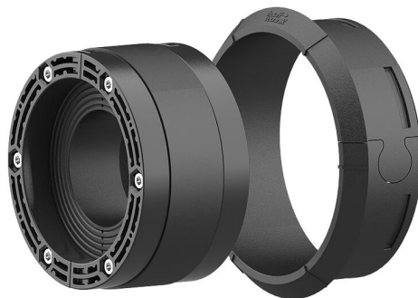
Slika može odstupati od odabranog proizvoda

Za uporabu u zidnoj uvodnici i plastičnoj prirubnici HSI150. Razdijeljena izvedba za brtvljenje kabela koji se trebaju postaviti ili su već postavljeni.