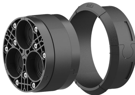
Slika može odstupati od odabranog proizvoda

Za uporabu u zidnoj uvodnici i plastičnoj prirubnici HSI150. Razdijeljena izvedba za brtvljenje kabela koji se trebaju postaviti ili su već postavljeni.