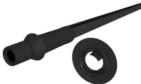
Slika može odstupati od odabranog proizvoda

Prikladno za kosi uvod kroz zid ili podnu ploču.