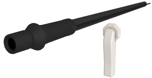
Slika može odstupati od odabranog proizvoda

Prikladno za kosi uvod kroz zid ili podnu ploču.