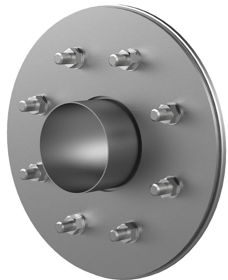
Slika može odstupati od odabranog proizvoda

Za zatiplavanje putem proturane cijevi, krunskog provrta ili proboja.