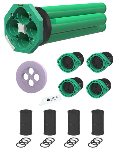
Slika može odstupati od odabranog proizvoda

Za raspodjelu strujnih i komunikacijskih vodova od zgrade do zemljišta.