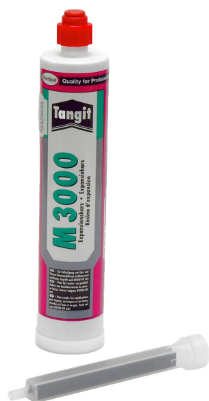
M3000 2 komponensű gyanta