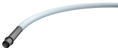
Sistema di tubi a spirale