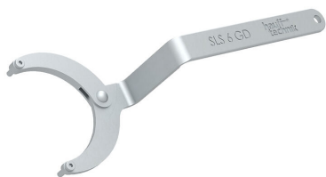
Chiave a bussola snodabile