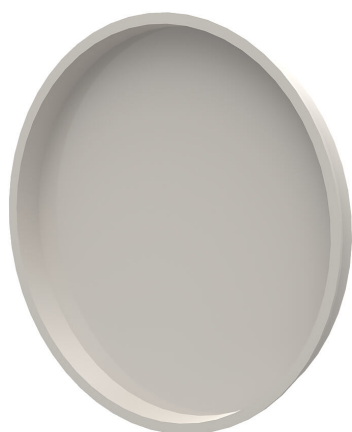
Coperchio in PE