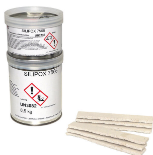
Set di montaggio