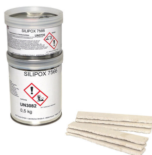
Set di montaggio