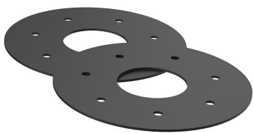
Inserti in gomma