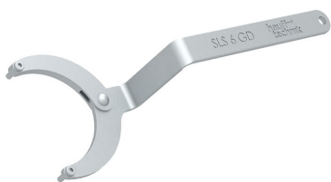
Chiave a bussola snodabile