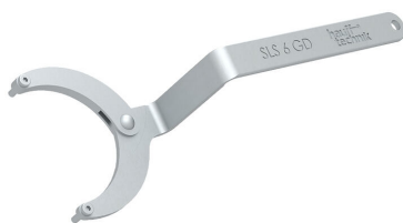
Chiave a bussola snodabile